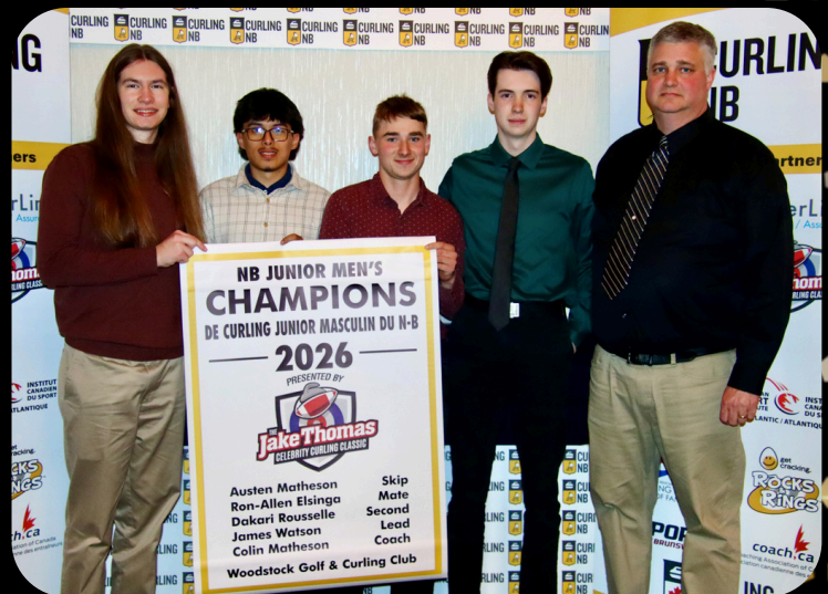
NB Junior Men