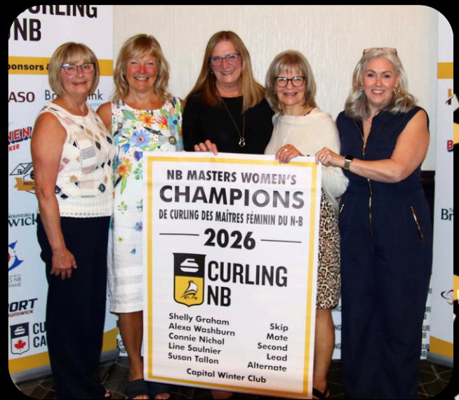
NB Masters Women