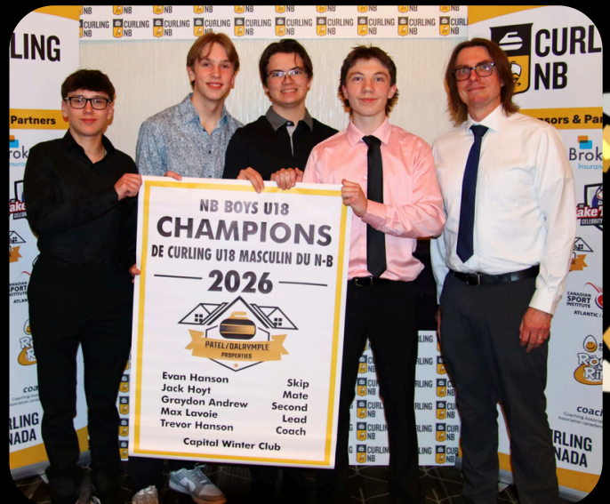
NB U18 Men