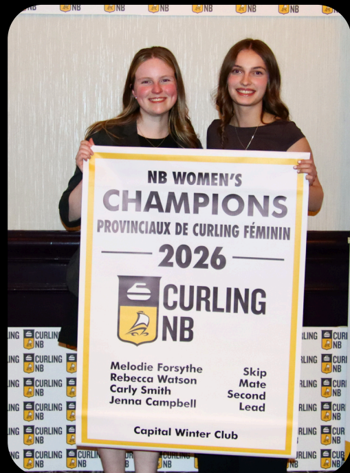
NB Women's Champions