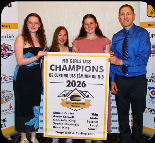
NB U18 Women