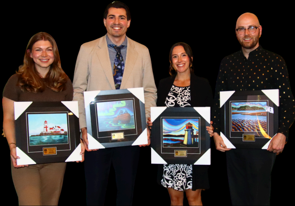
Adult Team of the Year 2025 Team Comeau