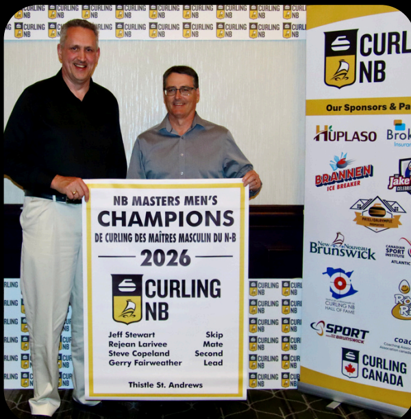
NB Masters Men