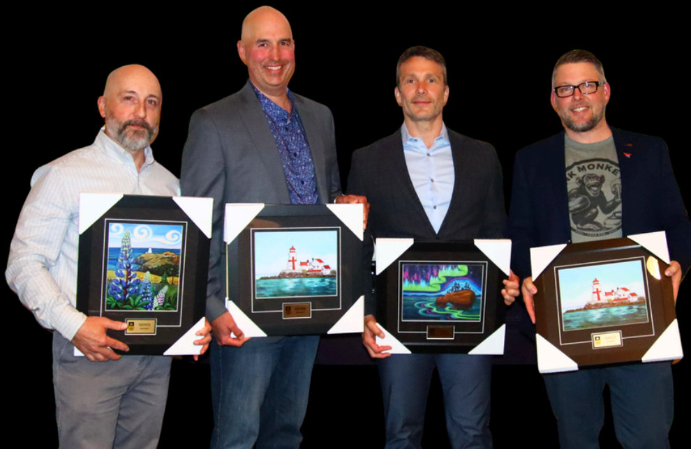
Recreational Team of the Year Rink Monkeys