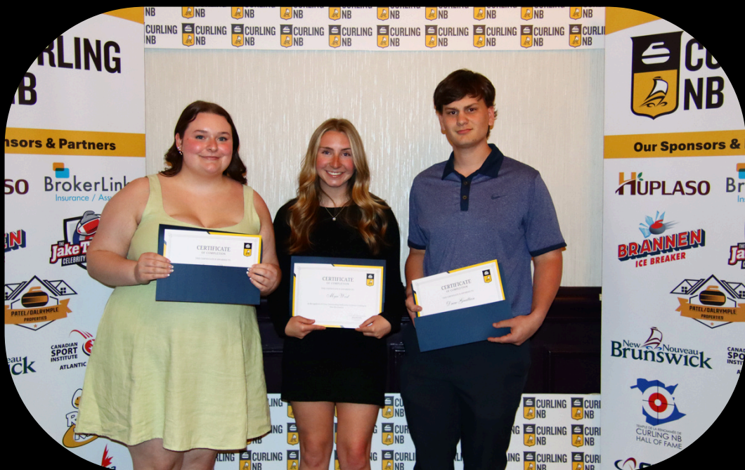
Junior Aging Out Certificates