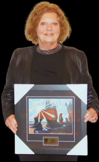
Curling Club Sponsor of the Year