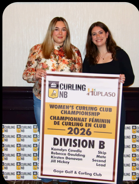
Women's Curling Club Champions