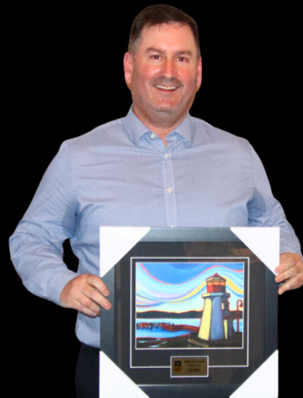
50+ Team of the Year 2025 Team Grattan