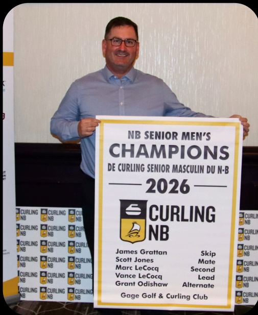
NB Senior Men