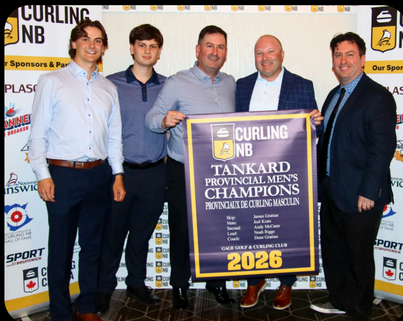
NB Men's Tankard