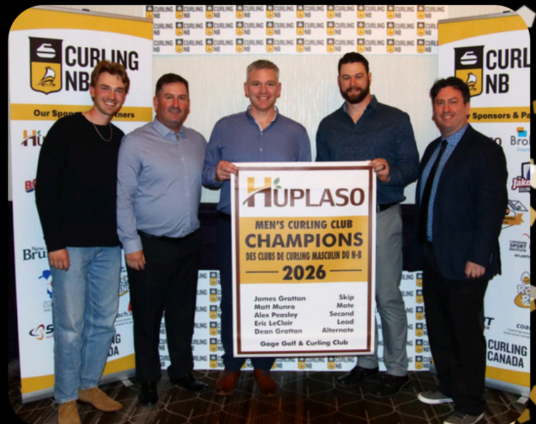
Men's Curling Club Champions