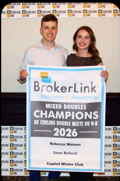
NB Mixed Doubles