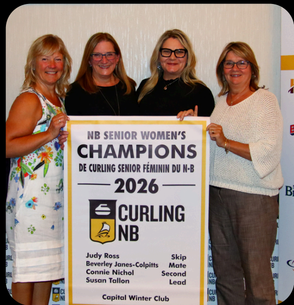
NB Senior Women