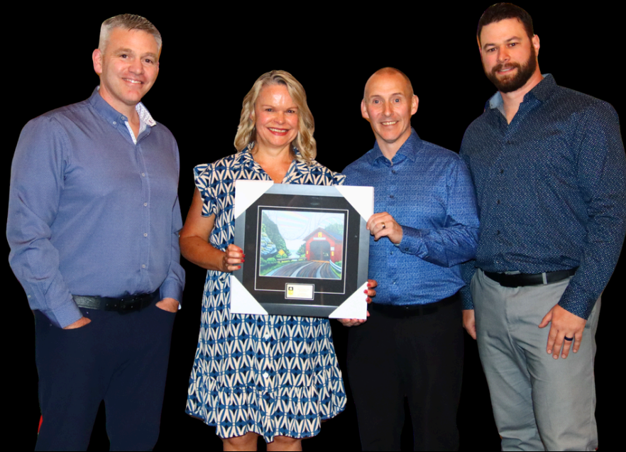
Curling Centre of the Year Gage Golf & Curling Club