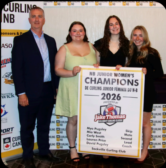
NB Junior Women